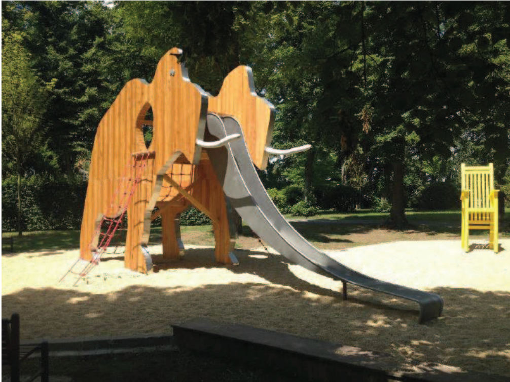
Fig. 2: Beispielmodell eines Holzmammuts (Fa. Quappen Holzbau)

Das bespielbare Holzmammut stellt einen zentralen Ausstellungspunkt im Außenbereich des Schleswig-Holsteinischen Eiszeitmuseums dar. Thematisch sollen hier verschiedene Lebensraumdarstellungen der kaltzeitlichen Landschaftsentwicklung integriert werden. Die lebensgroße Nachbildung wird durch ihre Präsentation in einem 2014 angelegten Findlingsgarten realisiert, angepasst an eine pleistozäne Lebenswelt. In dieser naturnahen Spielumgebung können auch flachwüchsige Pflanzen der kühlen Regionen (z. B. Silberwurz, verschiedene Flechten, Hartriegelgewächse) einen idealen Rahmen schaffen und Kindern ein bewusstes Erleben der eiszeitlichen Landschaft bieten. Spielmomente, Naturerfahrung und die pädagogische Konzeption des Schleswig-Holsteinischen Eiszeitmuseums münden so in dieser Spielumwelt in einer Auseinandersetzung mit Lernerfahrungen. Das Schleswig-Holsteinische Eiszeitmuseum möchte durch den Erwerb eines Holzmammuts, einen Rahmen einer Spielwelt schaffen, in der Kinder Größe und Ausprägung dieser eiszeitlichen Großsäugetiere sinnlich erfahren können. Großformatige Tafeln informieren dabei die Besucher über die Lebensumwelt wie z. B. Informationen zur Entwicklung und zum Leben der Mammuts und weiterer kaltzeitlicher Tiere oder die pflanzenökologische Entwicklung während der letzten Kaltzeit.